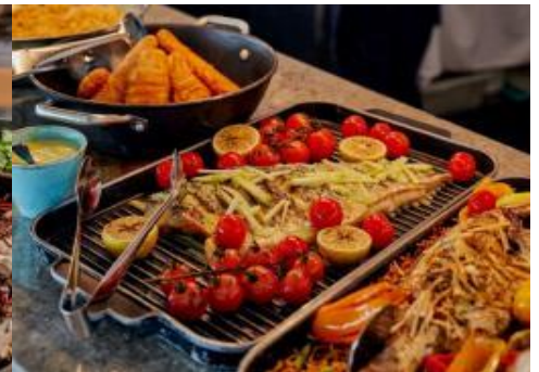
*เมนูมีการปรับเปลี่ยนตามฤดูกาล*