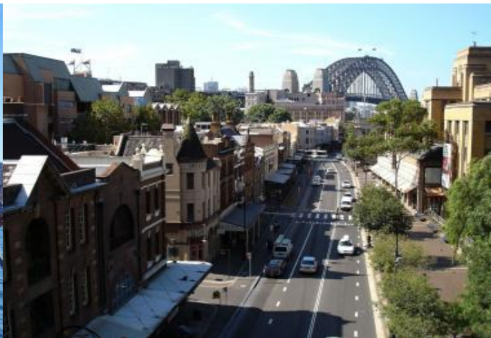
สวยๆ เก็บภาพบรรยากาศตามอัธยาศัย