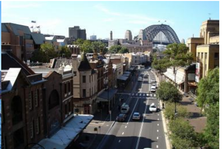
สวยๆ เก็บภาพบรรยากาศตามอัธยาศัย