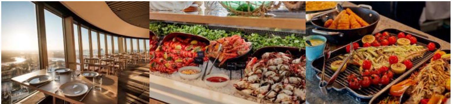
*เมนูมีการปรับเปลี่ยนตามฤดูกาล*

นำท่านเข้าสู่ที่พัก SYDNEY METRO MARLOW HOTEL / HOLIDAY INN POTTS POINT หรือเทียบเท่า (คืนที่5)