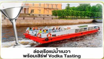
ล่องเรือแม่น้ำเนวา พร้อมลิ้ม Vodka Tasting