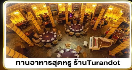
ทานอาหารสุดหรู ร้านTurandot