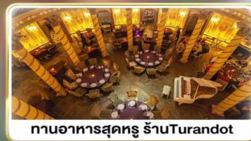
ทานอาหารสุดหรู ภัตตาคาร Turandot