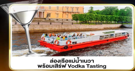
ส่งเรือแม่น้ำแคว พร้อมลิ้ม Vodka Tasting