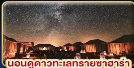
นอนดูดาวทะเลทรายซาฮารา