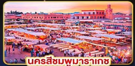
นครสีชมพูมารากะช