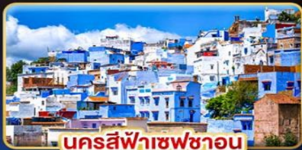
นครสีฟ้าเชฟชาอูน

ท่องเที่ยวดินแดนฟ้าจรดทราย เก็บทุกไฮไลท์ใน โมร็อกโก อารยธรรมสุดขอบทวีป