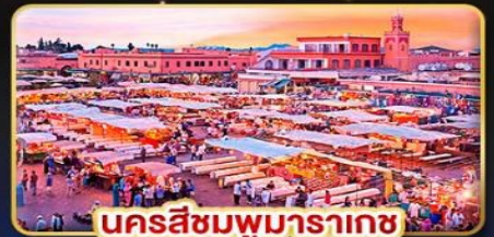
นครสีชมพูมารากะช