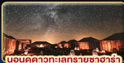
นอนดูดาวทะเลทรายซาฮารา