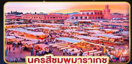
นครสีชมพูมารากช