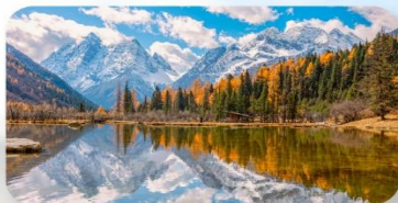
สี่ครุณี