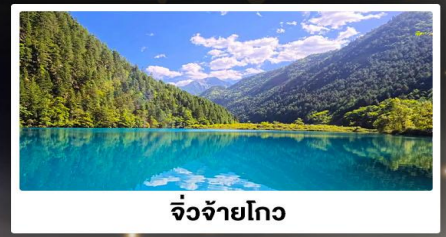
จั๋วจ้ายโกว