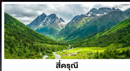
สี่ครุณี