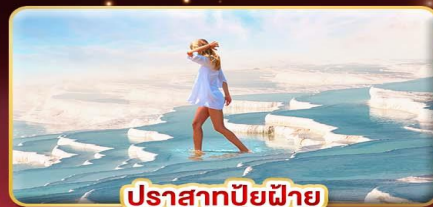
ปราสาทน้ำแข็ง