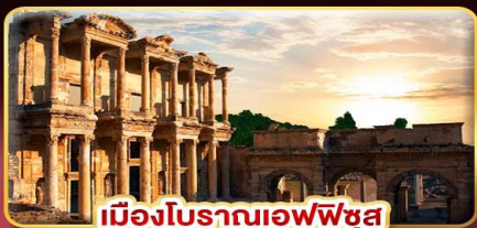
เมืองโบราณเอเฟซุส