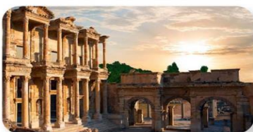
เมืองโบราณเอเฟซุส