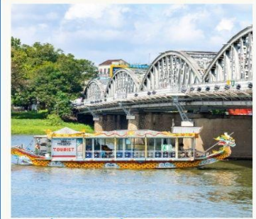
ล่องเรือมังกร แม่น้ำหอม