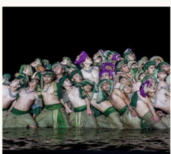
ชมโชว์ Hoi An Memories