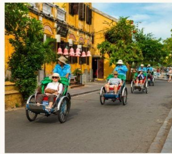
นั่งสามล้อชมเมือง