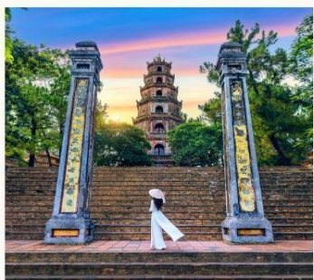
วัดเทียนมู่