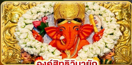
องค์สิทธินายัก