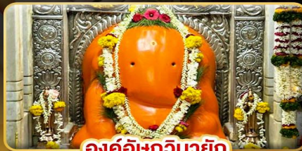
องค์อชฏินายัก