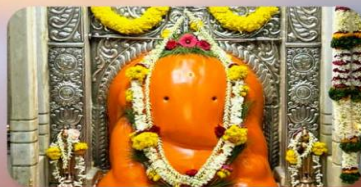
องค์อัยกวิณายัก