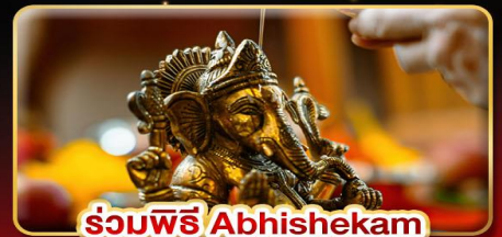
ร่วมพิธี Abhishekam