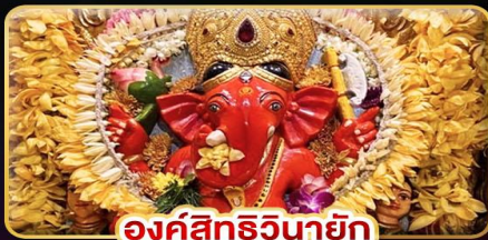
องค์สิทธีวินายก