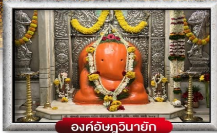
องค์อักษุวินายก