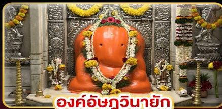
องค์อชฏวินายก