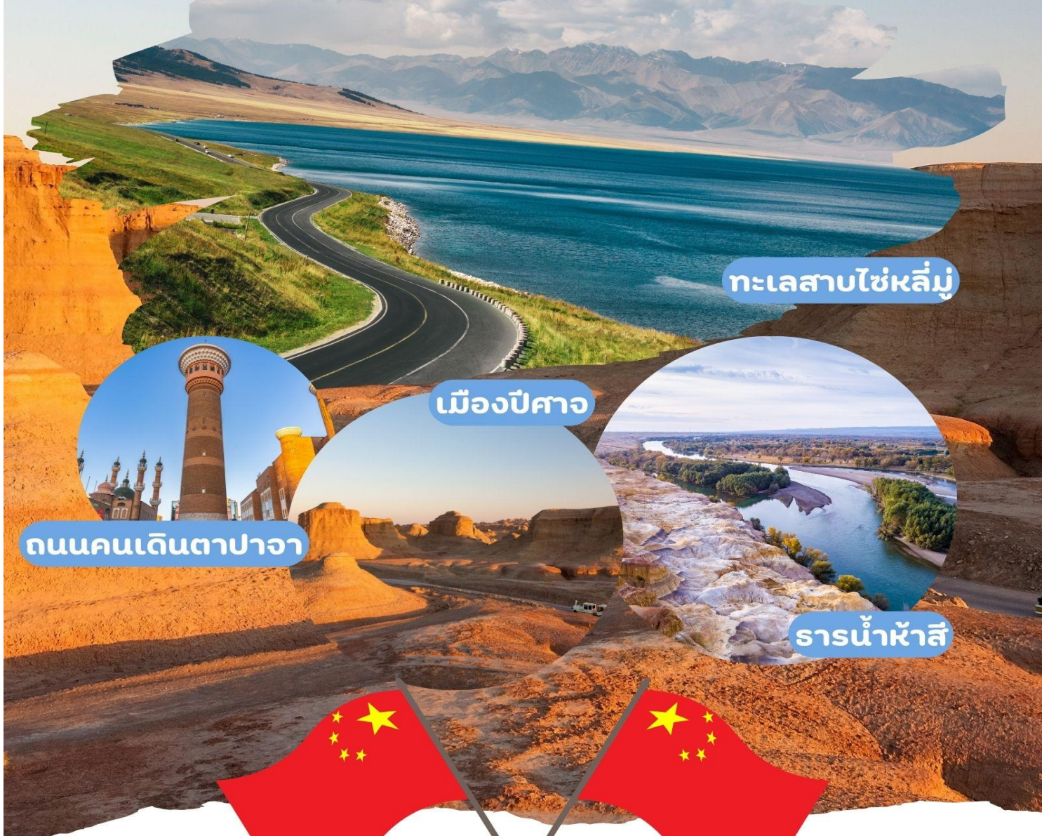
ทะเลสาบไซหลี่มู่