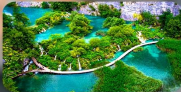
อุทยานแห่งชาติพริตวิเซ่