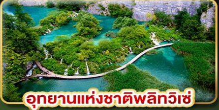
อุทยานแห่งชาติพลิตวิเช่