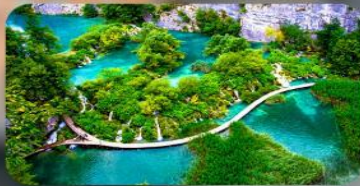
อุทยานแห่งชาติพริตวิเซ่