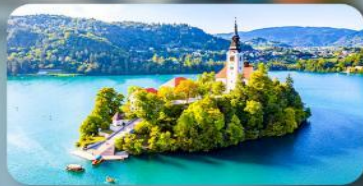
โบสถ์พระแม่มาเรียแห่งเบลค