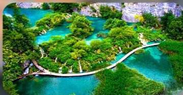
อุทยานแห่งชาติพริตวิเซ่