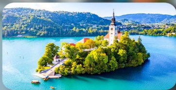
โบสถ์พระแม่มาเรียแห่งเบลค