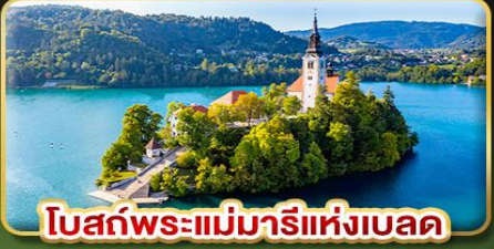
โบสถ์พระแม่มาเรียแห่งเบลด

บินตรงสู่ออสเตรีย สัมผัสความงามไข่มุกแห่งท้องทะเลยุโรปใต้