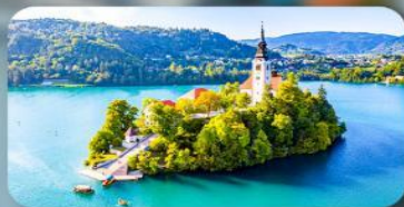
โบสถ์พระแม่มาเรียแห่งเบลค