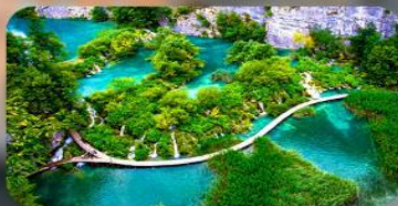
อุทยานแห่งชาติพริตวิเซ่