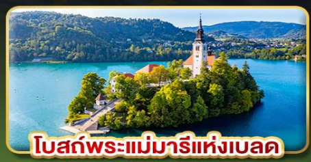
โบสถ์พระแม่มาเรียแห่งเบลด