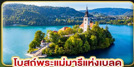
โบสถ์พระแม่มาเรียแห่งเบลด