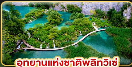
อุทยานแห่งชาติพลิตวิเช่