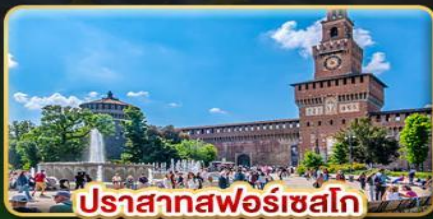
ปราสาทสפורเชลโก