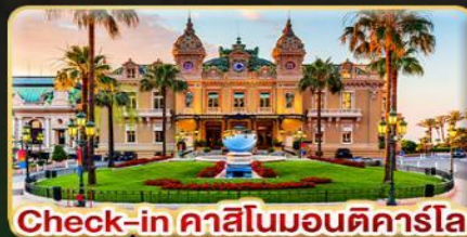
Check-in คาสีโนมอนติคาร์โล