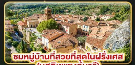
ชมหมู่บ้านที่สวยงามที่สุดในฝรั่งเศส (มูสตียาแซงก์มารี)