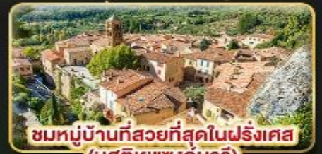
ชมหมู่บ้านที่สวยงามที่สุดในฝรั่งเศส (มูสตียาแซงก์มารี)