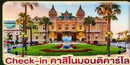
Check-in คาสีโนมอนติคาร์โล