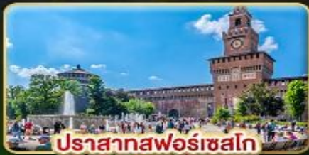
ปราสาทฟอโรเซลโต