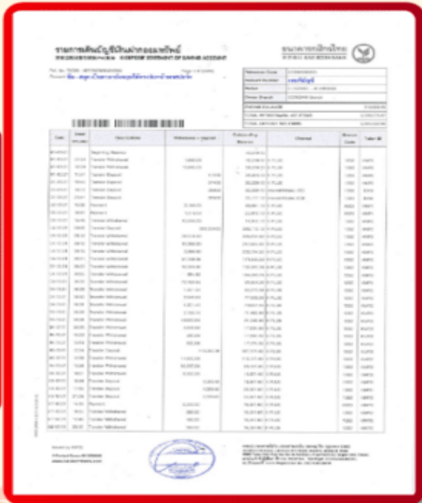
ตัวอย่าง Bank Statement ที่ผู้สมัครต้องขอจากธนาคาร

3.4 ปรับสมุดบัญชีธนาคารตัวจริง และเตรียมไปในวันที่ยื่นวิชา