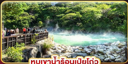
ทิวเขาน้ำร้อนเป่ย์โต่ว