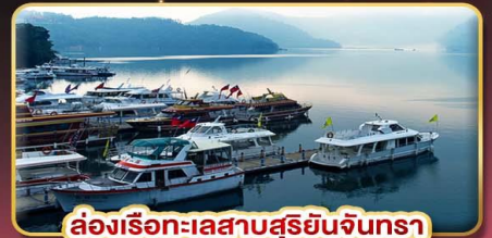
ล่องเรือทะเลสาบสุริยอันจินตรา