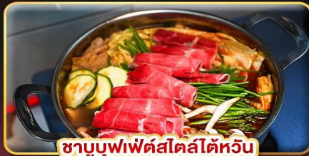
ชาบูบุฟเฟ่ต์สไตล์ไต้หวัน