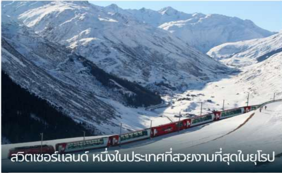
สวิตเซอร์แลนด์ หนึ่งในประเทศที่สวยงามที่สุดในยุโรป

เที่ยวชมสถานที่ท่องเที่ยวยังคง บรรยากาศดั้งเดิมของสวิตเซอร์แลนด์ อันสวยงาม (Unseen Switzerland) นั่งรถไฟและรถรางชมวิว ขบวนที่มีชื่อ เสียงของสวิตเซอร์แลนด์ ถึงห้าขบวน