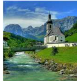
ออสเตรียบาวาเรียดินแดนแห่งเทพนิยาย

ออสเตรีย – บาวาเรีย (Austria-Bavaria) ดินแดนวัฒนธรรมเก่าแก่ที่ครอบคลุมสองประเทศและแทบแยกกันไม่ออกเลยที่เราเที่ยวอยู่ในออสเตรียหรือเยอรมัน ท่านจะประทับใจไปกับหมู่บ้านเล็กๆน่ารัก ที่ตั้งอยู่บริเวณริมทะเลสาบในเทือกเขา “เยอรมัน-ออสเตรียแอลป์” พร้อมบริการอาหารรสเลิศและที่พักอย่างดีระดับ 4 ดาว หรูหราที่เราคัดสรรมาให้ท่านได้พักผ่อนอย่างเต็มที่ให้การเดินทางของทุกท่านคุ้มค่าที่สุดในเส้นทางที่สวยงามที่สุดของออสเตรีย-บาวาเรีย