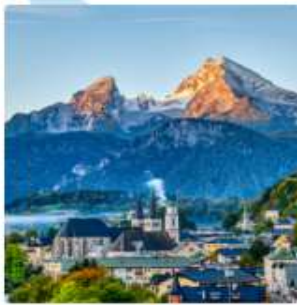
ออสเตรียบาวาเรียดินแดน แห่งเทพนิยาย