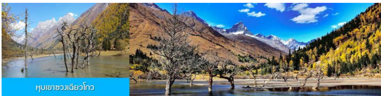
หุบเขาขวงเจียวโกว

หลังอาหารนำท่านเที่ยวชม หุบเขาขวงเจียวโกว 双桥沟景区 ที่เป็นแหล่งท่องเที่ยวที่สวยงามที่สุดแห่งหนึ่งในเขตอุทยานภูเขาสี่ครุณี นำท่านนั่งรถบัสของอุทยานที่วิ่งไปผ่านเส้นทางที่สร้างคู่ขนานกับลำธารภายในหุบเขา ท่านจะได้สัมผัสกับความสวยงามของทัศนียภาพธรรมชาติที่หาชมได้ยาก โดยมีภูเขาหิมะสูงตระหง่านอยู่เบื้องหลัง ธารน้ำใสไหลริน และสระน้ำที่มีสีเขียวมรกต ในฤดูใบไม้ผลิและฤดูร้อนท่านจะได้เห็นฝูงจามรีท่ามกลางทุ่งหญ้าเขียวขจี ส่วนในฤดูหนาวทุ่งหญ้าและพื้นดินจะปกคลุมด้วยพรมหิมะสีขาว รถบัสของอุทยานจะนำนักท่องเที่ยวไปยังจุดชมวิิวสำคัญต่าง ๆ ภายในเขตอุทยาน เพื่อให้ท่านท่องเที่ยวได้เที่ยวชมสถานที่และถ่ายรูปตามอัธยาศัย จนครบแก่เวลา นำคณะขึ้นรถบัสออกจากอุทยาน (รวมค่ารถบัสเที่ยวชมในอุทยานแล้ว)