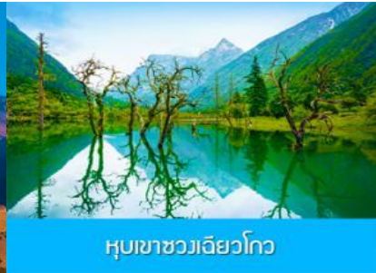
หุบเขาชวงเฉียวโกว