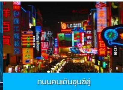
ถนนคนเดินชุนชี่ลู่