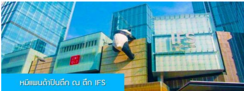
หมีแพนด้าปีนตึก ณ ตึก IFS