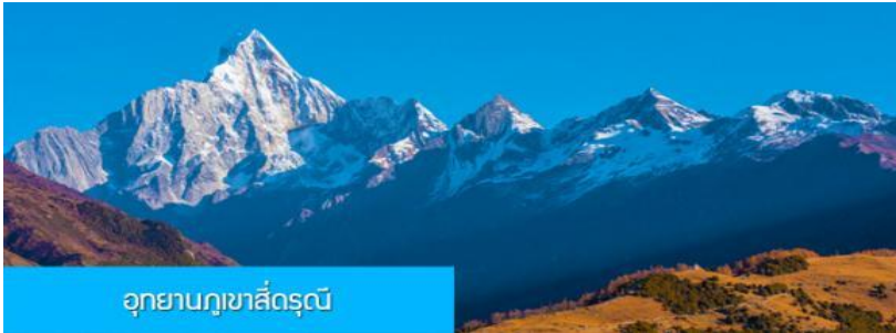
อุทยานกุช่าลี่ดรุณี