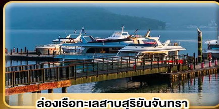
ล่องเรือทะเลสาบสุริยจินทรา