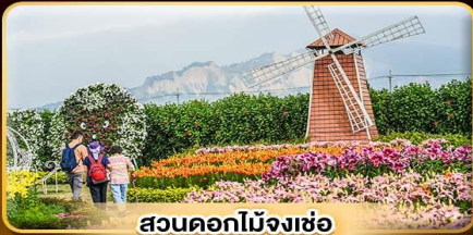
สวนดอกไม้จงเซอ

เค้ด้าทีดาวเน้ตีกไทเป 101 แชน้ำแร่ส่วนตัวในห้องพัก