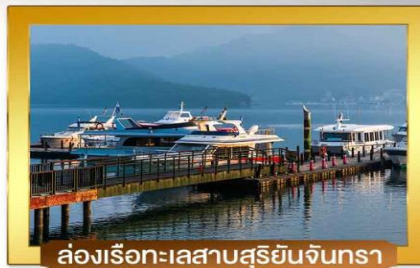
ล่องเรือทะเลสาบสุริยอันจินตรา