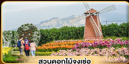
สวนดอกไม้จงเช้อ

เค้าที่ดาวเน้ตีกไทเป 101 แชน้าแร่ส่วนต้อในห้องพัก