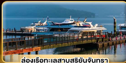
ล้องเรือทะเลสาบสุริยนจินทรา