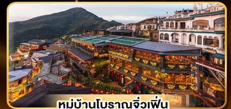
หมู่บ้านโบราณจิวเฟ้น