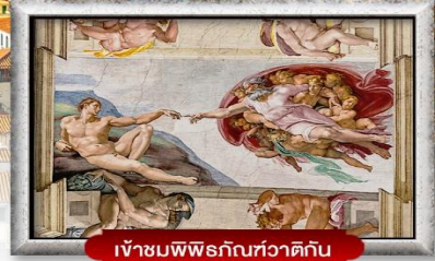
เข้าชมพิพิธภัณฑ์วาติกัน