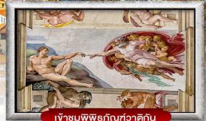
เข้าชมพิพิธภัณฑน์วาติกัน