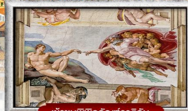
เข้าชมพิพิธภัณฑ์วาติกัน