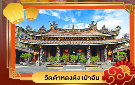
วัดต้าหลงตั้ง เป่าอัน