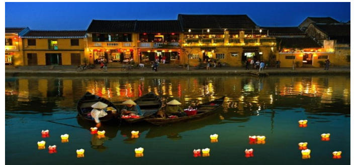
รูปภาพใช้ประกอบการโฆษณาเท่านั้น

นำท่าน ล่องเรือยามเย็นที่เมืองฮอยอัน (Thu Bon River Cruise) เป็นประสบการณ์ที่ไม่ควรพลาดเมื่อมาเยือนเมืองเก่า การล่องเรือโคมลอยในแม่น้ำ ให้ท่านได้สัมผัสกับบรรยากาศอันเป็นเอกลักษณ์ของเมือง ปล่องโคมลอยในแม่น้ำและชมเมืองเก่าที่ได้รับการขึ้นทะเบียนเป็นมรดกโลกโดยยูเนสโก สัมผัสทัศนียภาพและกลิ่นอายของฮอยอันในยามค่ำคืน