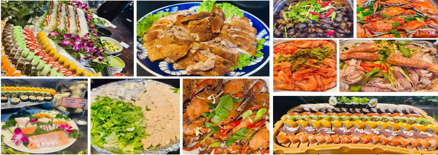
รูปภาพใช้ประกอบการโฆษณาเท่านั้น