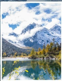
อุทยานบิ๋นเฟิงโกว