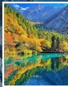
อุทยานแห่งชาติ จิวจ้ายโกว