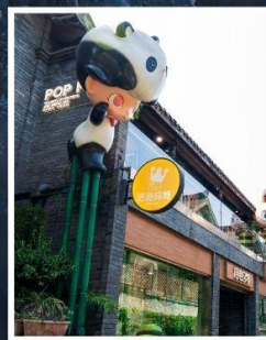
ถนนชอยกวางแคบ