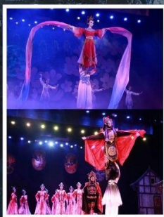
โซ่วจ้อไบ้