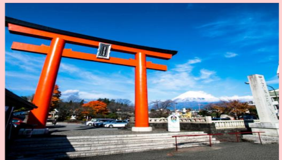
ภาพ เซ้เพอประกอบกาจไฆะฌนา