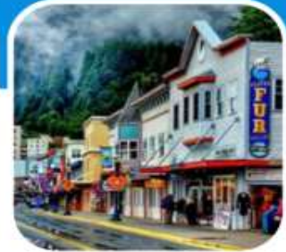
เมืองท่าเล็กๆน่าเที่ยว เมือง Juneau

บินไปนอนก่อน 2 คืน ก่อนลงเรือ เที่ยวแวนคูเวอร์ รวมค่าวีซ่า ซอปปังจู่ใจ บิน สายการบิน แอร์ไชน่า