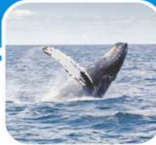
ชมวาฬ ไอซ์ซีสแตกพ้อย