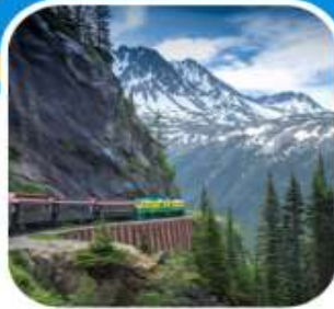
ชมเมืองสแก็กเวย์