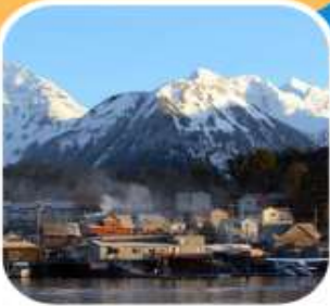
ชมหมีที่ SitKa

รวมทัวร์ล่องเรือชมปลาวาฬ * รวมทัวร์ชมหมีสีน้ำตาล * รวมค่าวีซ่าแคนาดา (ETA) รวมเที่ยวชายฝั่ง แวนคูเวอร์* จูโน * สแก็กเวย์ * ไอซ์ซี สแตกพ้อย * ซิดกา Royal Caribbean Cruise Line ตระกูลเรือสำราญที่ดีที่สุดในการล่องอลาสกา