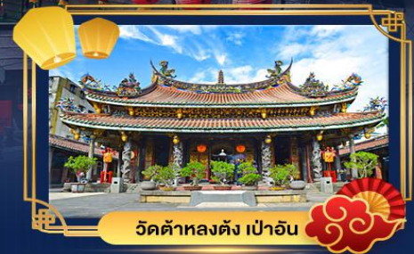
วัดต้าหลงตั้ง เป่าอัน