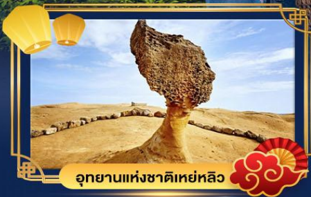
อุทยานแห่งชาติเหยหลิว