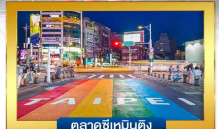
ตลาดซีเหมินติง