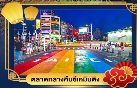
ตลาดกลางคืนซีเหมินติง