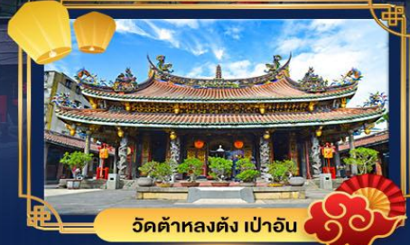
วัดต้าหลงตั้ง เป่าอัน