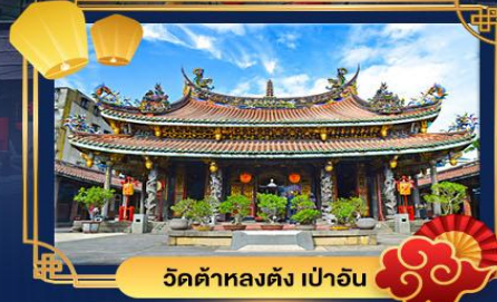
วัดต้าหลงตั้ง เป่าอัน