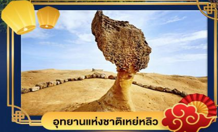
อุทยานแห่งชาติเหย์หลิว