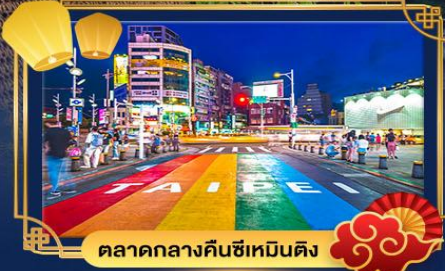
ตลาดกลางคืนซีเหมินติง