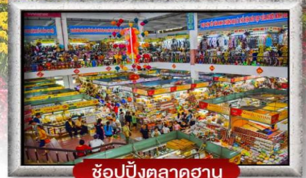
ซอปปิงตลาดฮาน