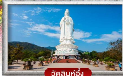
วัดลินห์ฮื่อง