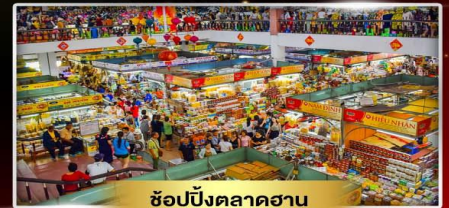
ช้อปปิ้งตลาดฮาน