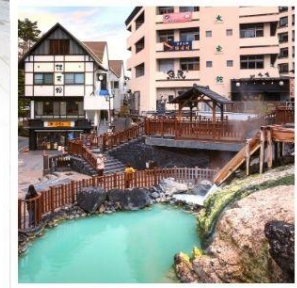
คุซัทสึ ออนเซ็น