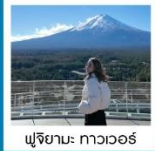
ฟูจิยามะ: ทาวเวอร์