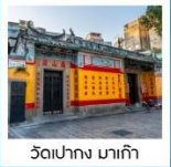
วัดเป่ากง มาเก๊า

ถนนฮอปป์ิงคาจูอิซาว่า / สวนสาธารณะโอเมโงชิดาชิ / เมืองคุซัทสึ นั่งกระเช้าอากาศ: อิวาตาคะ / จุดชมวิวยาคูมะเมากิเทนฮาร์เบอร์ / คามิโคจิ สะพานคัปปะ / ปราสาทมัตสึโมโตะ / ฟูจิยามะ: ทาวเวอร์ / ฮอปป์ิงชินจู วัดนาริตะ / อีออน พลาซ่า / วัดอามา / เจ้าแม่กวนอิมปราสาททงริมทะเล วัดเป่ากง / เซนาโต้สแควร์ / ถนนคนเดินไทปา เดอะ ลอนดอนเนอร์ / เดอะ เวเนเชียน