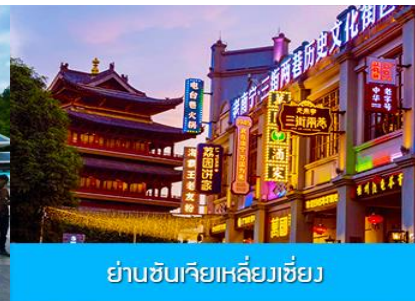
ย่านชานเจียเหลียงเจียง