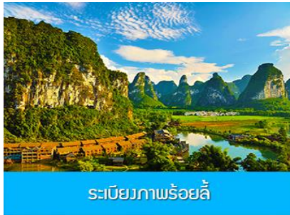
ระเบียบภาพร้อยลี่

หลังอาหารนำท่าน ชมแสงสี ณ เมืองโบราณไผ่ผิง 崇左太平古镇 เป็นอุทยานท่องเที่ยวระดับ 4A ของเมืองฉงจั่ว ที่มุ่มทუნกว่า 1800 ล้านหยวนเพื่อเนรมิต เมืองโบราณแห่งนี้ให้เป็นแหล่งท่องเที่ยวย้อนยุคสมัยราชวงศ์ตั้งที่โดดเด่นที่สุดของมณฑลกว่างซี ท่านจะได้พบกับอาคารบ้านเรือนโบราณ(จำลอง) กำแพงเมืองโบราณ และมุมถ่ายภาพสวยเก๋มากมาย ท่ามกลางแสงสีที่ตกแต่งอย่างตระการตาภายในเมืองโบราณแห่งนี้..... พักที่ CHONGZUO YA STE HUAXI HOTEL โรงแรมระดับ 4 ดาวท้องถิ่น หรือเทียบเท่าในเมืองฉงจั่ว