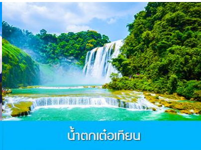
น้ำตกเต๋อเทียน