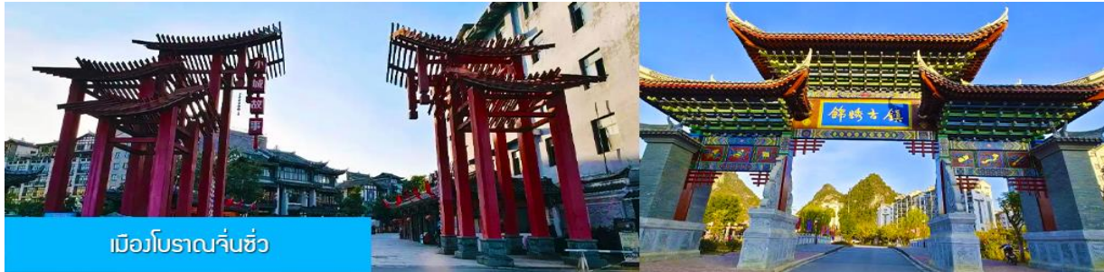
เมืองโบราณจีนซิว