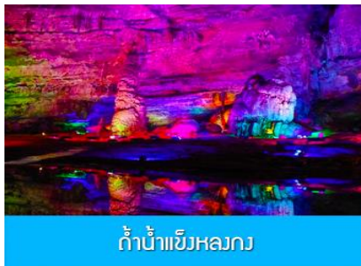
ถ้ำน้ำแข็งหลงกง