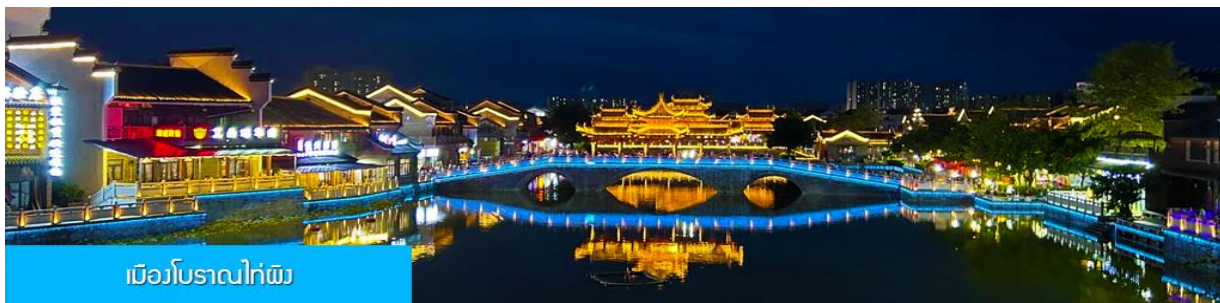
เมืองโบราณไต้ผิง