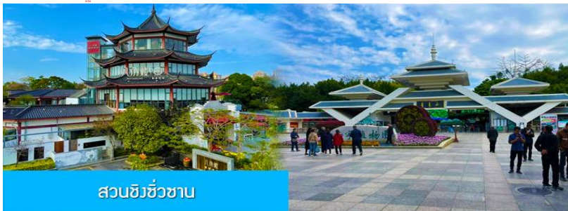
สวนชิงชิวซาน

พักที่ JINGXI HUANQIU HOTEL ระดับ 4 ดาวท้องถิ่นหรือเทียบเท่าในเมืองจิ้งซี