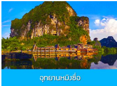
อุทยานหมีวู้

พักที่ MINGSHI YISHU HOTEL ระดับ 3 ดาวห้องดีนหรือเทียบเท่าในอุทยานหมิงชื้อ