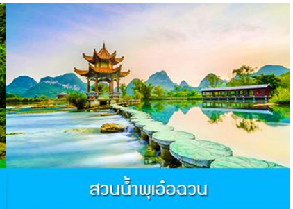
สวนน้ำพุอ๋อฉวน

วันที่สาม อุทยานหมิงชื้อ – น้ำตกเต๋อเทียน – สวนน้ำพุห่าน (อ๋อฉวน) เมืองจิ้งซี - เมืองโบราณจินชิว