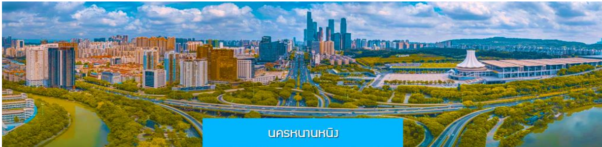
นครหนานหนิง

-ไม่เก็บทิปก่อนเที่ยว เพราะมั่นใจในคุณภาพ