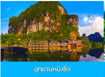
อุทยานหมิงชื้อ

พักที่ MINGSHI YISHU HOTEL ระดับ 3 ดาวห้องดีนหรือเทียบเท่าในอุทยานหมิงชื้อ