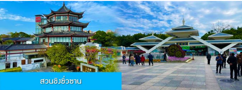
สวนชิงชิวซาน

พักที่ JINGXI HUANQIU HOTEL ระดับ 4 ดาวท้องถิ่นหรือเทียบเท่าในเมืองจิ้งซี