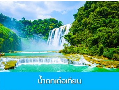
น้ำตกเต๋อเทียน