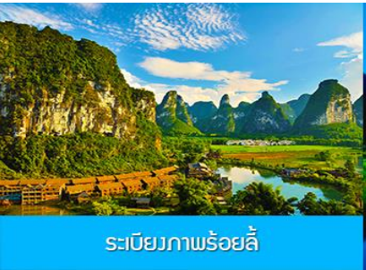
ระเบียบภาพร้อยลี่

หลังอาหารเช้าท่าน ชมแสงสี ณ เมืองโบราณไผ่ผิง 崇左太平古镇 เป็นอุทยานท่องเที่ยวระดับ 4A ของเมืองฉงจั่ว ที่มีหมู่บ้านกว่า 1800 ล้านหยวนเพื่อเสริมเมืองโบราณแห่งนี้ให้เป็นแหล่งท่องเที่ยวอันยุคสมัยราชวงศ์ตั้งที่โดดเด่นที่สุดของมณฑลกว่างซี ท่านจะได้พบกับอาคารบ้านเรือนโบราณ(จำลอง) กำแพงเมืองโบราณ และมุมถ่ายภาพสวยเก๋มากมาย ท่ามกลางแสงสีที่ตกแต่งอย่างตระการตาภายในเมืองโบราณแห่งนี้..... พักที่ CHONGZUO YA STE HUAXI HOTEL โรงแรมระดับ 4 ดาวท้องถิ่น หรือเทียบเท่าในเมืองฉงจั่ว