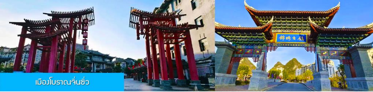
เมืองโบราณจีนซิว