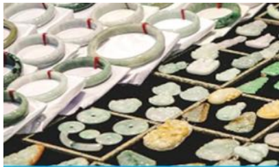
ศูนย์จำหน่ายผลิตภัณฑหยก