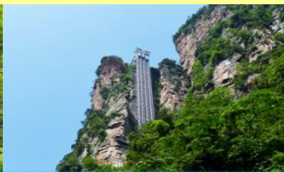
ลิฟท์แก้วเป่หลง