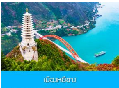
เมืองหยี่ซาง