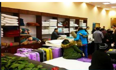
ศูนย์จำหน่ายผลิตภัณฑ์ชาวพารา