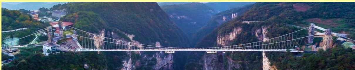
สะพานกระจากข้ามหุบเขาแกรนด์แคนยอน

ลิฟท์แก้วได้ชัดเจน นำท่านขึ้นลิฟท์แก้วขึ้นสู่ยอดเขาอวตาร นำท่านเดินชมจุดชมวิวต่าง ๆ บนยอดเขาอวตาร ได้แก่ภูเขาเสาเฉลียว สะพานหนึ่งในได้หล้า... อัตราค่าบริการรวม ค่าบัตรเข้าอุทยาน ค่ารถรับส่งภายในเขตอุทยาน ค่าน้ำดื่มของไกด์ท้องถิ่น