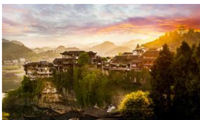
เมืองโบราณ ฟู่หรงเจิ้น

รับประทานอาหารกลางวัน ณ ภัตตาคาร *หมวย่างเกาหลี