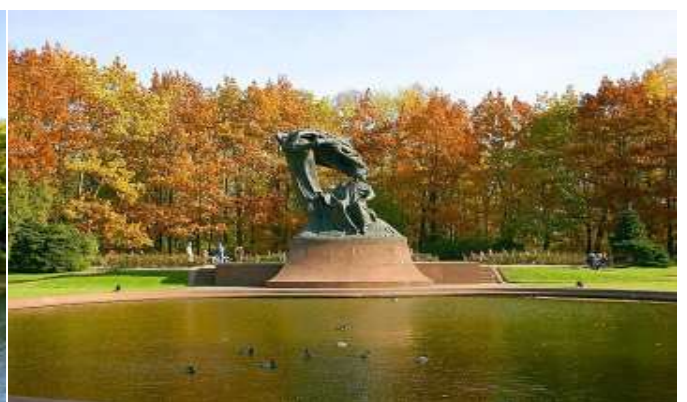
(Lazienki Royal Park) ชมอนุสาวรีย์เฟรเดอริก โชแปง (Chopin's Monument ) คีตกวีผู้มีชื่อเสียงระดับโลก ผลงานทุก