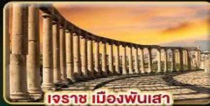
เระชา เมืองพันเสา