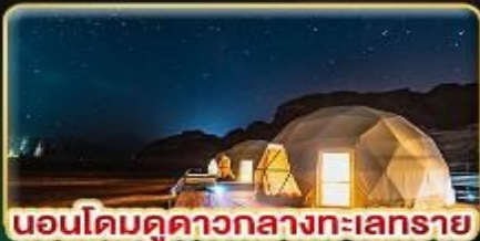
นอนโดมดูดาวกลางทะเลทราย

★ บินตรงสู่ "จอร์แดน" เยือน 7 มหัศจรรย์ของโลก