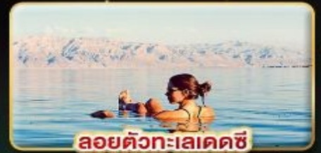
ลอยตัวทะเลโคคซี