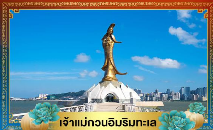
เจ้าแม่กวนอิมริมทะเล