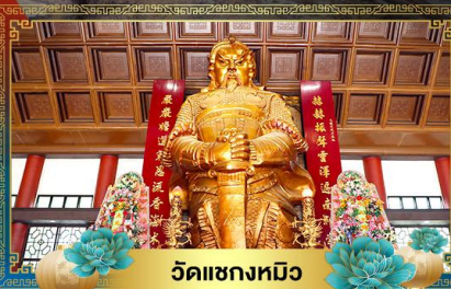
วัดเข่งหมิว