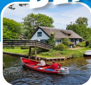
ท่องเที่ยวครบ ตลอดการเดินทาง