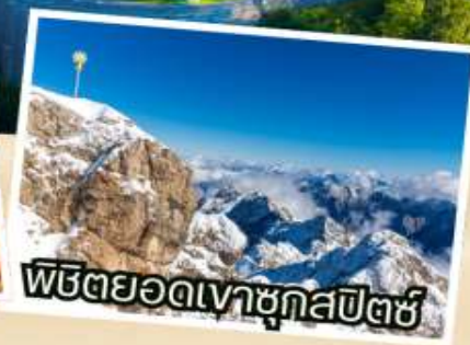
พีชียอดเขาชุกสปีตซ์