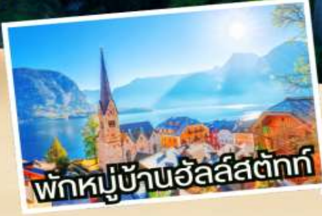
พักหมู่บ้านอัลส์ตัดท์