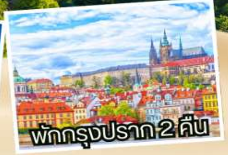
พักกรุงปราก 2 คืน